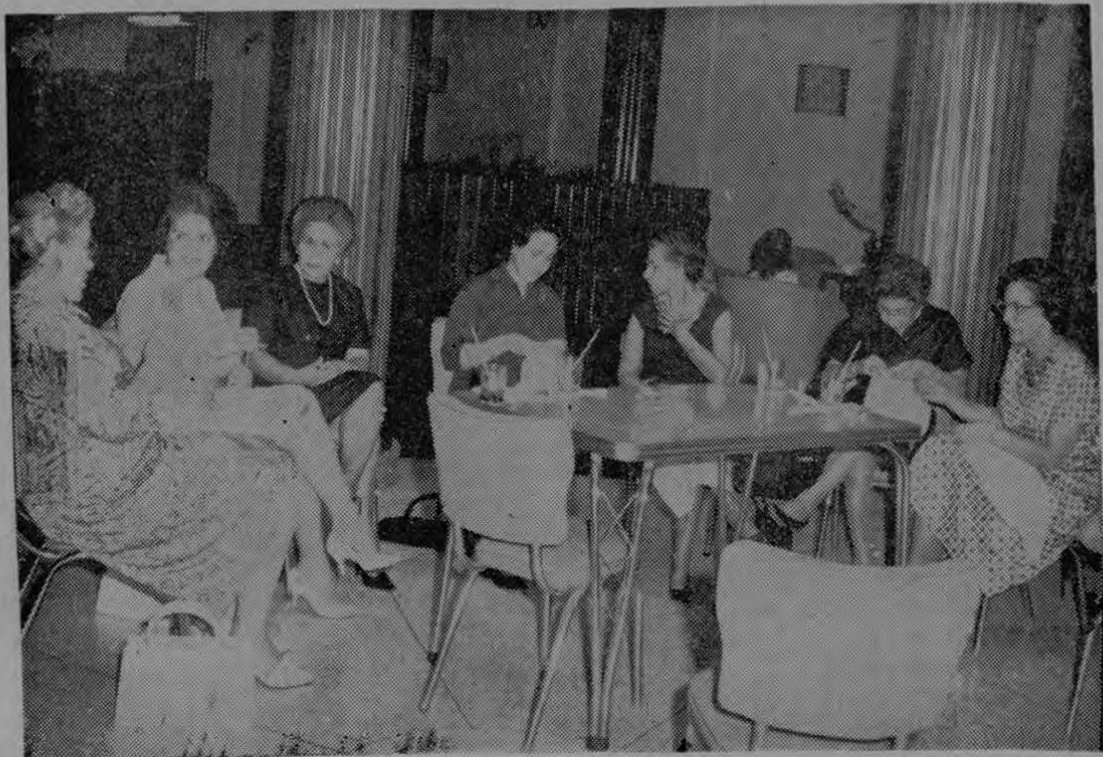
Unas cosiendo, las otras tejiendo y todas en amena charla, las damas asistentes al té de ayer tarde en la Casa de España, disfrutaron de ratos de verdadero esparcimiento.

pados —un pasatiempo que aprendió cuando era niña— y visita los clubes nocturnos de Hollywood, en compañía del actor Glenn Ford. Su marido atiende sus negocios de publicaciones en Roma mientras ella trabaja en Hollywood. "Ya soy grande —dijo Gina. Después de 15 años de matrimonio, bien puedo viajar sola". Pero, ¿qué significa esa soledad de la actriz italiana... tristeza o felicidad?.